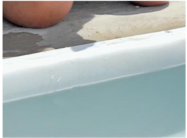
Du niveau d'eau (pour fixer les pontets aux bons endroits)