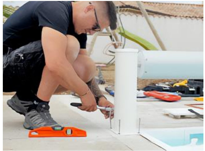
Puis fixer les poteaux