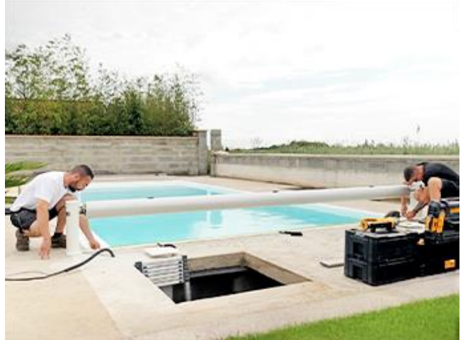
Aligner le centre de la largeur du bassin et celle de l'axe