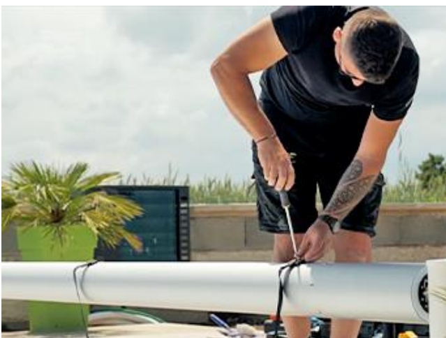
Fixer les sangles de rappel sur l'axe