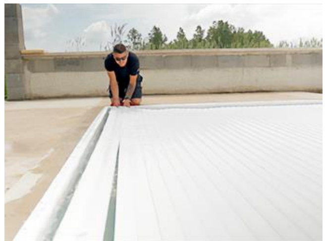
Attention, la température doit être supérieure à 10°