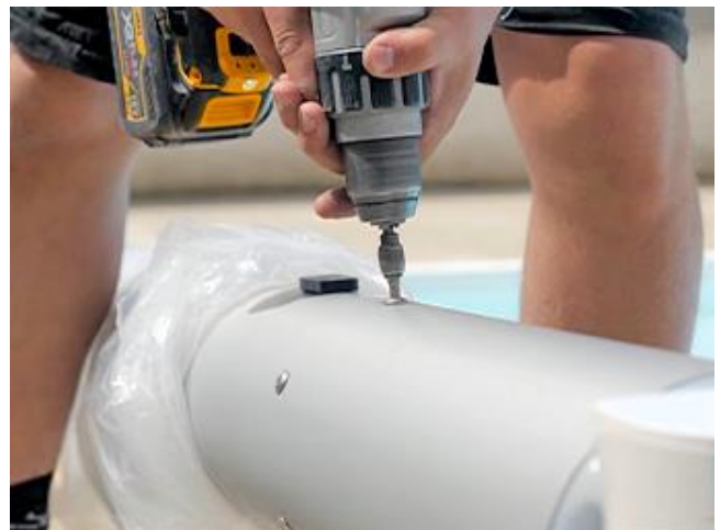
Visser précautionneusement, avec un couple bas