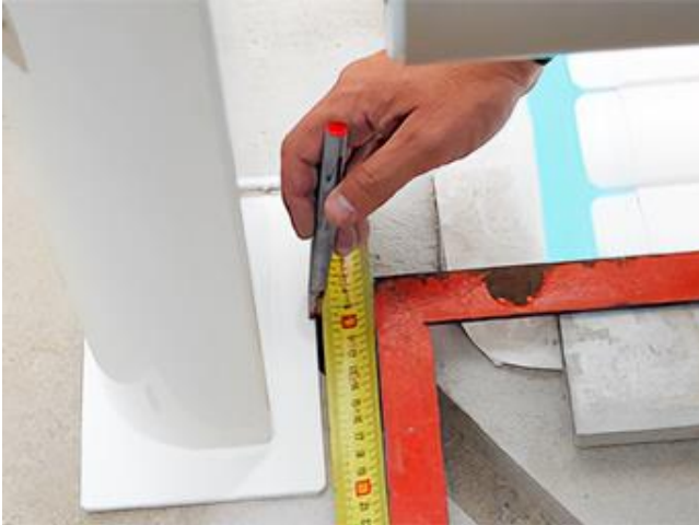
Centrer les poteaux