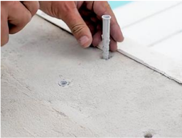
Insérer les chevilles