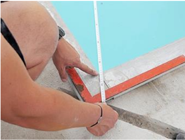
Des dimensions du bassin