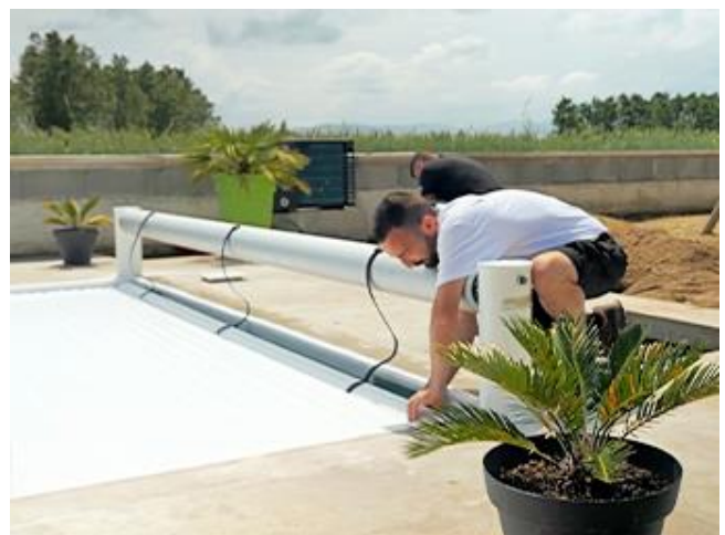
Verrouiller la couverture pour protéger votre piscine