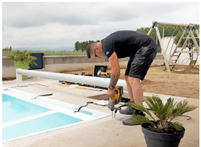
... et percer !