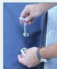
Crocheter les sandows aux lames du tablier