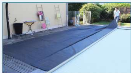
Déplier la Protect One 2.0 à côté du bassin