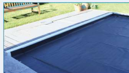
Remonter les renforts sur la paroi du bassin