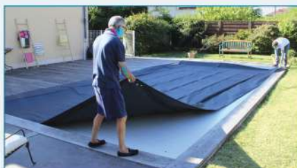
Poser sur le tablier et tendre