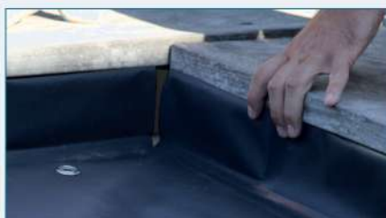
Passer les sandows dans les œillets