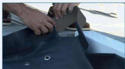
Renforcer les angles avec la mousse fournie